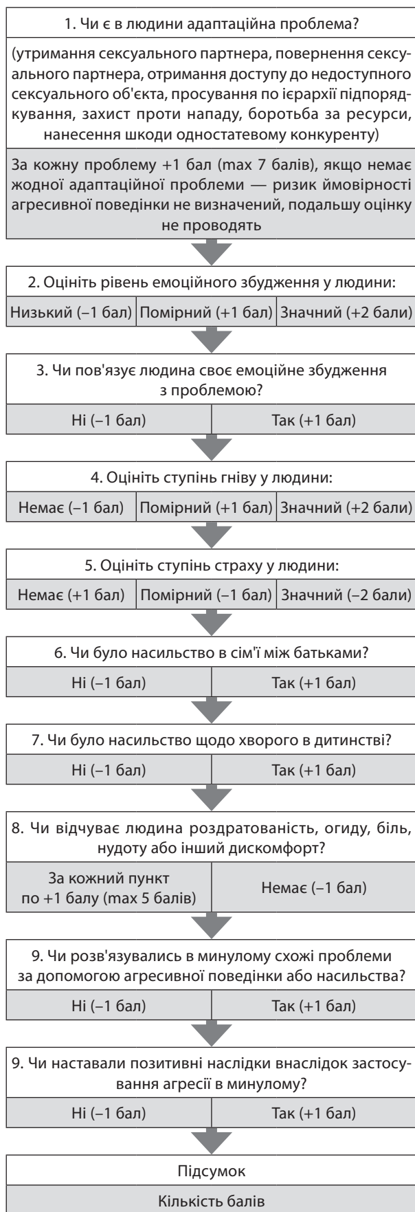
Рис. 2. Шкала прогнозування агресивної поведінки Тимофєєва та Шорнікова

Приклад. Чоловік, 42 роки. Його дружина пішла до іншого чоловіка, котрий йому знайомий. Чоловік дуже емоційно збуджений, пов'язує збудження з сексуальною зрадою дружини, відчуває дуже сильний гнів, помірний страх, роздратованість та відразу. Чоловік хоче повернути дружину. В сім'ї чоловіка батько знущався над матір'ю, але він сам раніше не проявляв агресії щодо своєї дружини. Насильство щодо чоловіка в дитинстві не застосовували. Раніше агресивна поведінка щодо інших людей не призводила до розв'язання проблеми.